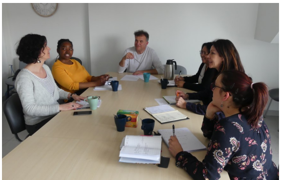
Réunion d'une partie de l'équipe du service Hébergement d'Urgence / Logement Temporaire

Equipe du service Hébergement d'Urgence / Logement Temporaire