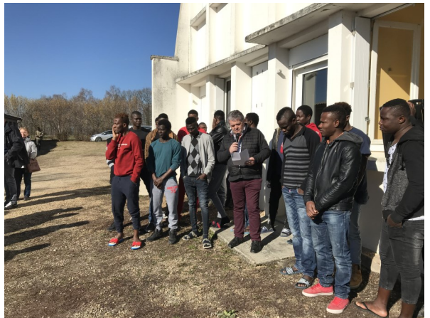
Rencontre des jeunes accompagnés par l'ANEF 63 avec les habitants de la commune de Saint-Priest-des-Champs

Pour y parvenir, nous tentons d'articuler la dimension politique avec la dimension culturelle au regard de la singularité de l'histoire du jeune. »