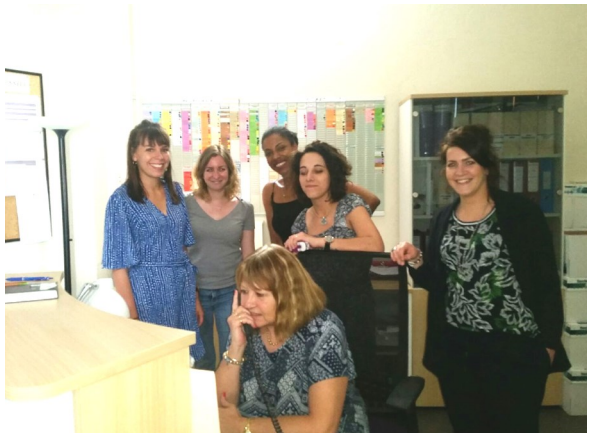
L'équipe du service AEMO a accompagné 568 enfants en 2018