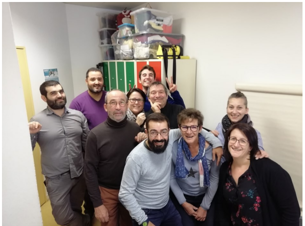
L'équipe du CHRS de Vichy