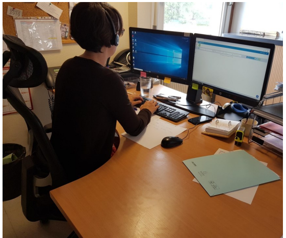
Equipe du SIAO / Urgence 115

Une fois sur le dispositif 115, les personnes victimes de violences seront accompagnées tout au long de leur parcours dans leurs démarches, avec comme objectif final un accès à un nouveau logement. »