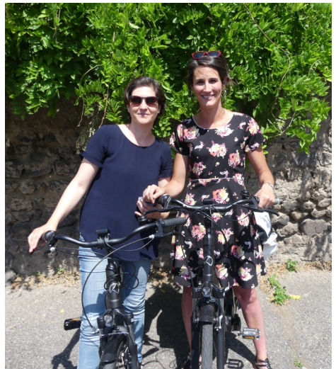
L'équipe du service ASLL intervient au domicile des personnes accompagnées