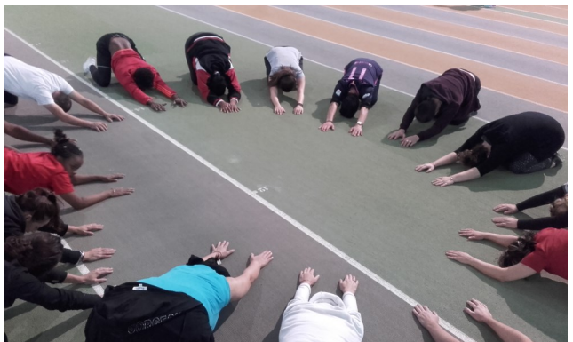
Séance de sport organisée avec les personnes hébergées au CHRS en partenariat avec l'association DAHLIR 63