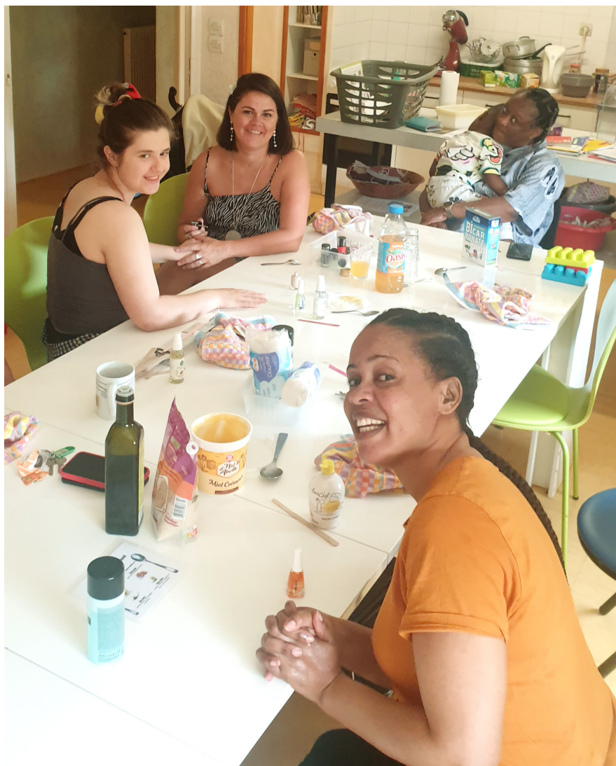
Atelier «Prendre soin de soi» au CHRS (rompre l'isolement et se revaloriser)

Les portes ouvertes organisées tout au long de l'année par les services pour exposer les projets aux partenaires furent enfin des moments riches : chacun avait carte blanche pour présenter ses activités et l'imagination a été au rendez-vous !